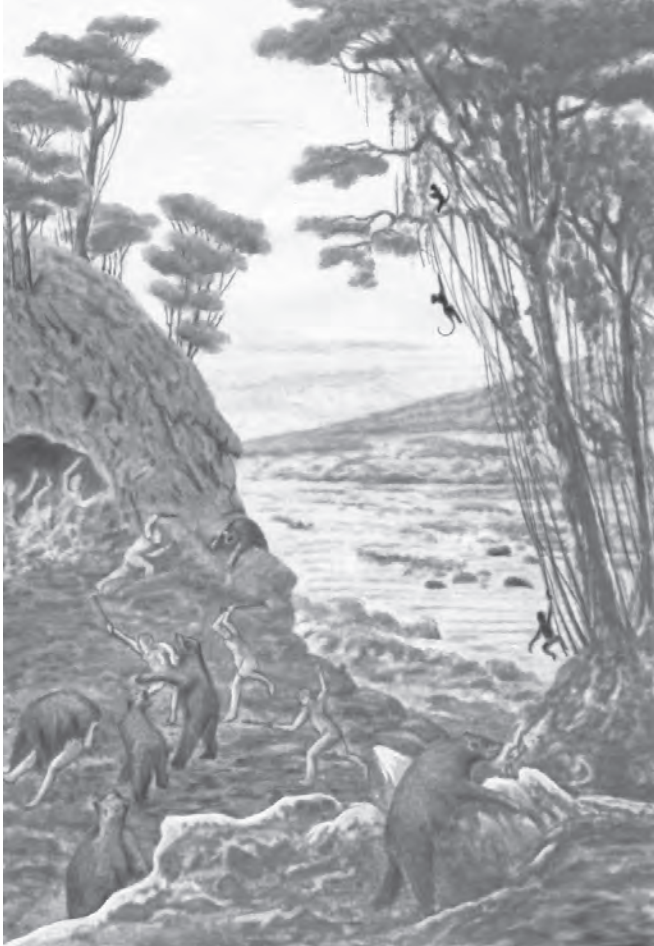
図2 途方もない数のホラアナグマの化石骨の印象にもとづいて、初期の学者たちはそのような動物が大きな群れをつくっていたと想像した。あるフランスの画家によるこの古い復元画（デザインオフィス'50による描き直し）には、人類とホラアナグマが亜熱帯の風景の中で闘っている様子が描かれており、そこではサルが木のつるにつかまっている。

このような考えは、早くも 1790 年に H. ゼメリンクによって出されていたが、この説はそのような初期の時代にはあまり重要なものとは考えられていなかった。なぜなら、人類がホラアナグマや他の絶滅動物がいた時代に生活していたという明確な証拠がなかったからである。脊椎動物につい